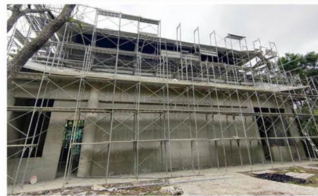
三清殿外觀建設進度

※ 轉帳後，請「傳真」匯款轉帳單據註明捐款人姓名、身份證號（如以公司名義捐款，請註明統一編號）、出生日期、電話、郵寄地址，或來電告知，轉入帳號末 5 碼、捐款日期、捐款金額及捐款人相關資訊，供我們核對資料並寄發收據給您。